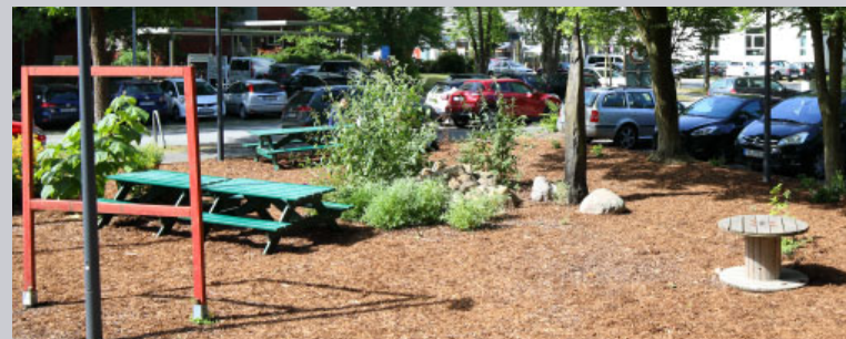
Study-Garden RoKo 40

Mehr Lust zum Kommen und Bleiben: Transfer-Ginko Unter diesem Motto wurden 2021 erste Schritte zur Anlage und Gestaltung einer attraktiven Grünfläche vor der Robert-Koch-Straße 40 eingeleitet. Der „Study Garden“ nahm Form an durch Gärtnerarbeiten, Beschaffung robuster Tische und Bänke und die Aufstellung einiger Schattenkrampfskulpturen samt Erläuterungstafel. Ziel war und ist es, Teamsitzungen oder Veranstaltungen der studentischen Lehre gegebenenfalls – bei schönem Wetter oder in Pandemie-Zeiten – ins Freie verlegen zu können.