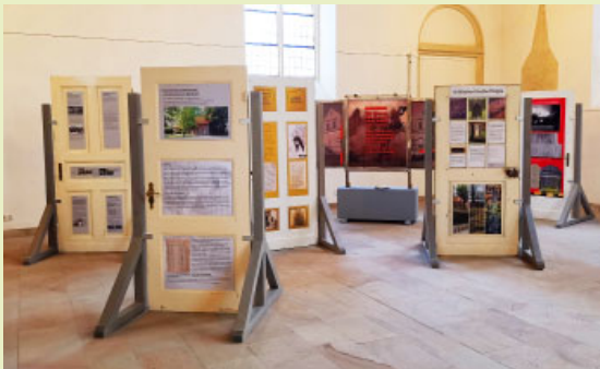
Ausstellung in der Großen Kirche in Burgsteinfurt.

Das bundesweite Gedenkjahr „1700 Jahr jüdisches Leben in Deutschland“ bekam im Rahmen der Expedition Münsterland eine regionale Komponente; die AFO und regionale Gruppen wurden offizielle Partner. Die koordinierende AFO steuerte als Höhepunkt vieler Aktivitäten die bürgerschaftlich geschaffene Ausstellung „Spurensuche_n im Gestern und Heute“ bei; sie war als Präsenzausstellung vorgesehen und wurde pandemiebedingt digital erweitert. Auf dem Weg zu