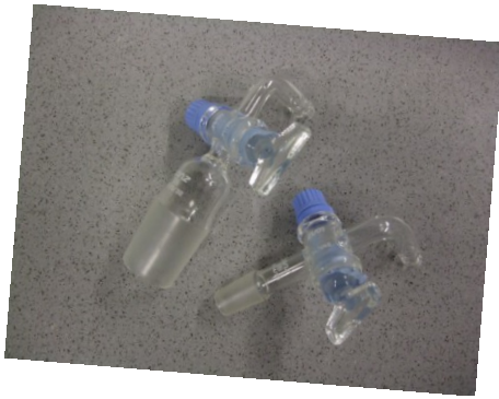
Übergangsstücke, Olive/ Kern, NS 29 mit Hahn und NS 14,5 mit Hahn