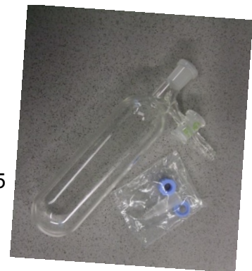
Schlenkkolben, 100 ml mit Küken, NS 14,5