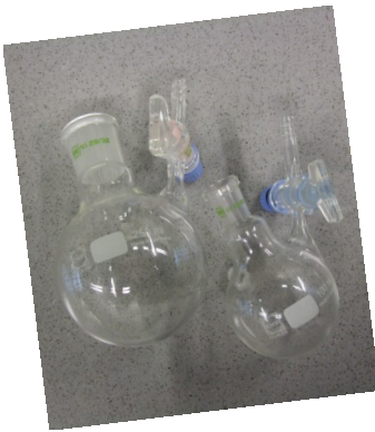
Stickstoffkolben, 100 ml, NS 14,5 und 250 ml, NS 29