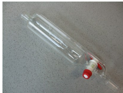
Tropftrichter mit Druckausgleich, 100 ml, NS 14,5