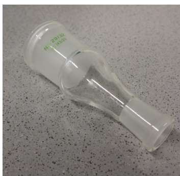
Übergangsstück, Hülse/ NS 14,5 auf Hülse/ NS 29