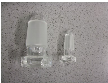
Glas-Hohlstopfen, NS 29 und NS 14,5