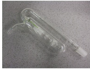
Blasenzähler mit Rückschlagventil