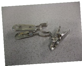
Gabelklemmen, NS 29 und NS 14,5