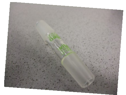
Übergangsstück, Kern/NS 14,5 auf Kern/NS14,5, gerade