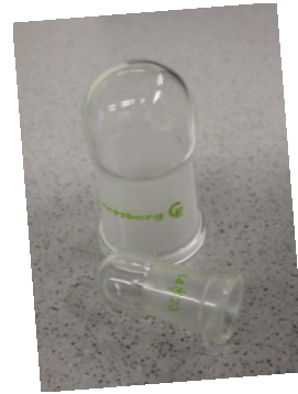
Schliffkappen, NS 29 und NS 14,5