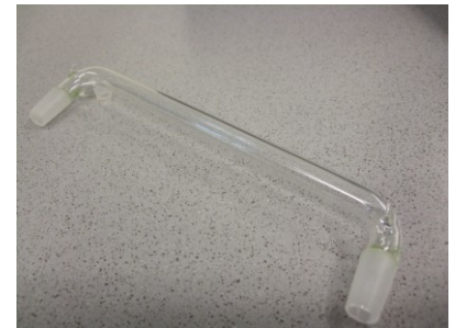
Kondensationsbrücke, L= 20 cm, NS 14,5