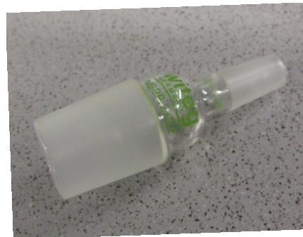
Übergangsstück, Kern/NS 29 auf Kern/NS 29, gerade