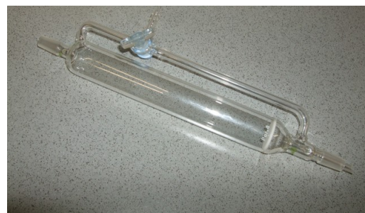
Umkehrfritte, 100 ml, 2xNS 14,5 mit Druckausgleich und Drei-Wegehahn