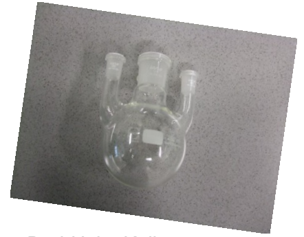
Drei-Hals- Kolben, 2x NS 14,5 1x NS 29