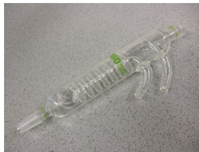
Dimrothkühler, L= 25 cm, 2x NS 14,5