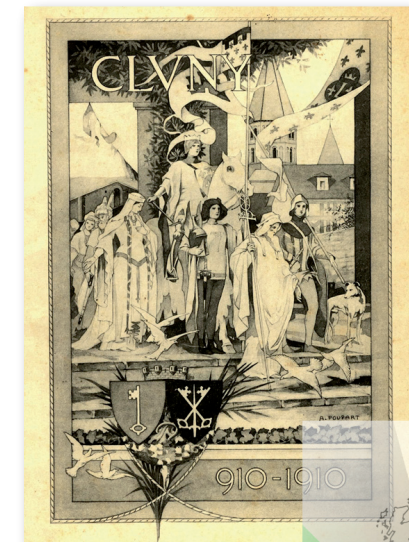
D'après le programme des festivités de 1910 Arch. Harvard (cf. J. Marquardt)