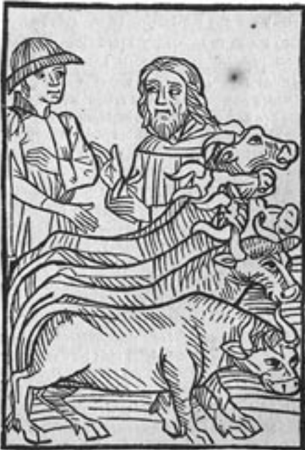
Abb. 2: Rindergröße im Mittelalter. Holzschnitt aus: Spiegel menschlicher Verhältniß, Basel 1476.

von Cremona am Ende des 10. Jahrhunderts voller Hohn an den Hof Ottos des Großen zu berichten, „lebt von Knoblauch, Zwiebeln und Porree und trinkt Badewasser“. Der Beherrscher des Westens hingegen gebärde sich niemals geizig und spare nicht am Bratenfleisch. 6