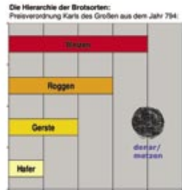
Abb. 3: Die Hierarchie der Brotsorten: Preisverordnung Karls des Großen aus dem Jahr 794.

Es ist gewiss kein Zufall, dass hier ausgerechnet der Schritt vom Hirsebrei zum Weißbrot zum Zielpunkt bäuerlicher Aufstiegsambitionen stilisiert wird. Brot war Statussymbol. Qualität und Verarbeitung der konsumierten Cerealien erweisen sich als zuverlässige Indikatoren sozialer Zuordnung innerhalb der mittelalterlichen Gesellschaft. 14 An der Spitze der Hierarchie der Brotsorten stand ohne Frage das Brot aus reinem Weizenmehl. Es war Standes- und Herrschaftsattribut des Adels, fand aber seinen Weg auch auf die Tische der städtischen Oberschichten. Auch wohlhabende Abteien mochten trotz des selbstauferlegten Armutsgebotes keineswegs auf diesen attraktiven Luxusartikel verzichten. Ob die Aussicht auf Weißbrotkonsum gar einen Grund für den Eintritt ins Kloster gebildet hat, wie es ein Predigtexempel des Zisterziensermönchs Humbert von Romans († 1277) darstellt, mag dahingestellt bleiben. Danach soll ein Laienbruder, bei seinem Eintritt ins Mönchleben nach seinen inneren Beweggründen und Wünschen befragt, geantwortet haben: „Weißbrot, und zwar oft!“ 15 Den Bauern und armen Leuten hingegen blieben zumeist nur minderwertige Brotsorten aus Roggen- oder Dinkelmehl übrig, die in Notzeiten zudem nicht selten durch Untermischung von Kräutern und Hülsenfrüchten gestreckt werden mussten.