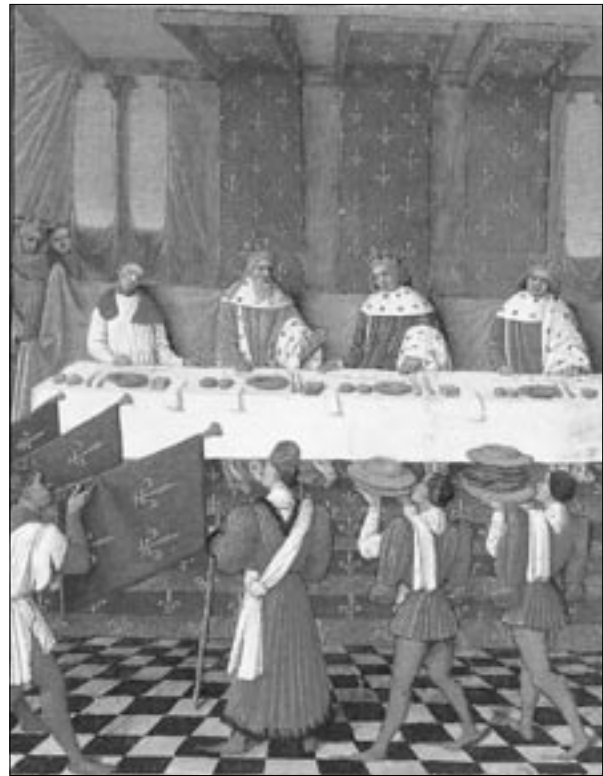
Festbankett zu Ehren Kaiser Karls IV. am Hof zu Paris im Jahr 1378. Abb. 7 (oben): Grandes Chroniques de France, um 1380; Abb. 8 (rechts): Chroniques des Jean Fouquet, um 1450.

Ritter und Damen paarweise miteinander speisten. Idealerweise ließ sich die Problematik der hierarchischen Sitzordnung durch eine runde Tafel lösen, so wie sie dem sagenhaften König Artus zugeschrieben wurde. In der gesellschaftlichen Realität des Mittelalters blieb solch eine Egalisierung des Ranges freilich weithin utopische Ausnahme.