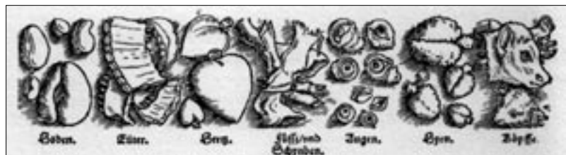
Abb. 10: Komplette Verwertung des Schlachtviehs. Schachtaffeln der Gesundheit, Straßburg 1533.

Die gehobene Küche des Mittelalters hatte dem Genießer weit mehr als Brei, Brot und Gebratenes zu bieten. In kulinarischer Hinsicht herrschte keineswegs ein dunkles Zeitalter. 42 Gewiss standen ihr die Früchte der neuen Welt, Mais, Kartoffeln, Tomaten und Kakao nicht zur Verfügung. Rohrzucker und Reis waren teure Importwaren. Aus dem Vorhandenen ließ sich dennoch eine eindrucksvolle Fülle von Gerichten kreieren, wobei die Nahrungsmittelpalette nicht zuletzt durch die fast restlosen Verwertung aller Teile des geschlachteten Viehs (Abb. 10) sowie dem Verzehr heute aus vielerlei Gründen ‚unmodern‘ gewordener Kleintiere erweitert wurde: Auf dem Speiseplan standen diverse Singvögel wie Spatzen und Schwalben, aber auch Pfau, Schwan und Reiher. Gleichfalls verzehrt wurden Bär, Eichhörnchen, Murmeltier, Igel und natürlich der Biber. Letzter