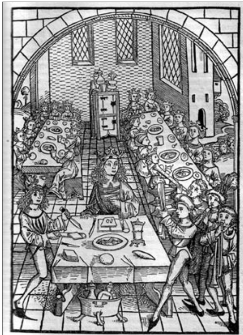
Abb. 5: Höfisches Bankett. Holzschnitt von Michael Wohlgemuth, Nürnberg 1491.

vormodernen Epoche. Der Sonnenkönig Ludwig XIV. etwa delectierte sich an gewaltigen Menüfolgen und auch im Spätmittelalter achtete mancher Herrscher penibel genau darauf, dass ein Maximum an Speisen auf seinen Teller gehäuft wurde. So erließ beispielsweise Philipp III. von Frankreich († 1285) im Jahr 1279 das Gebot, „dass kein Herzog, kein Baron, kein Graf, kein Prälat, kein Ritter, kein Kleriker und sonst niemand im Königreich, welches Standes er auch sei, zum Essen mehr als drei ganz gewöhnliche Gänge ausgeben dürfe“. 19 Üppigere Speisefolgen sollten dem königlichen Hof vorbehalten bleiben. „Da es beim Bedienen richtig ist, dass einige Personen dem Verhältnis ihres Standes entsprechend mehr geehrt werden“, so ließ es König Peter IV. von Aragon († 1387) im Jahr 1344 formulieren, „wünschen Wir, dass auf Unserem Teller Platz für die Speisen von acht Personen ist“. 20 Den Prinzen und Bischöfen seines Reiches gestattete er immerhin Raum für sechs, den Prälaten und Rittern für vier Gerichte. Den niederen Höflingen blieben hingegen mitunter nur karge Rationen, wie Aeneas Silvio Piccolomini 1444 klagend bemerkt: „Wie die Fliegen die vollen Tische, so umschwärmen sie die fetten Garküchen der Herren, doch wie königlich die Speisen auch sein mögen, die Fliegen erlangen doch mehr als sie“.