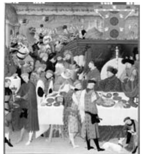
Abb. 11: Raffinierte Speisefolgen. Monatsbild Januar aus den Très Riches Heures des Duc de Berry, vor 1416.