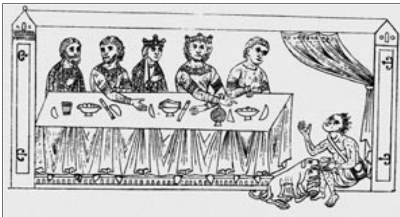
Abb. 4: Der Bettler Lazarus an der Tafel des Reichen. Federzeichnung aus: Herrad von Landsberg, Hortus deliciarum, um 1180.

„Man ist, was man isst“, diese Regel besaß im Mittelalter noch weitaus höhere Relevanz als heute. Was moderne Soziologen als die ‚feinen Unterschiede‘ innerhalb gesellschaftlicher Hierarchien ausmachen, war im hohen Mittelalter auch ohne ausgefeiltes wissenschaftliches Instrumentarium für jedermann wahrzunehmen. Wo die Quellenlage gut ist, gar detaillierte Speiseordnungen vorliegen, lassen sich die unterschiedlichen Relationen im Verzehr von Wein, Fleisch und Brot zwischen Herren und Knechten gar statistisch erfassen und minutiös nachvollziehen. 16 Dabei zeigt sich, dass eine Person umso mehr und umso fleischhaltiger aß, je höher ihr sozialer Status war. Doch Kampf um das Essen blieb nicht allein auf den Antagonismus von viel und wenig, von Adel und Bauern beschränkt. Er setzte sich auch innerhalb der sozialen Führungseliten ungehindert fort – dort freilich eingekleidet in sehr viel subtilere Formen und ein ausgeklügeltes Zeremoniell.