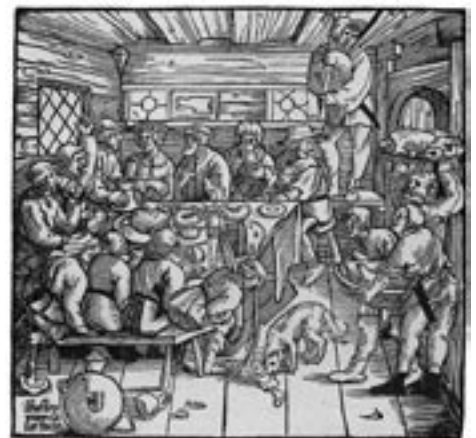
Abb. 9: Grobianisches Hochzeitsmahl auf dem Land. Holzschnitt des Nicolaus Solis, ca. 1550.

Doch gibt dieser Text tatsächlich die Realität mittelalterlicher Gelage wieder? Sicher nicht! Denn was Heinrich Wittenweiler über das Hochzeitsmahl des Bauern Bertschi Triefnas zu schreiben wusste, war nichts