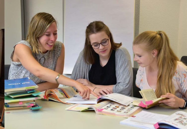
Forschendes Lernen in der niederländischen Sprachwissenschaft