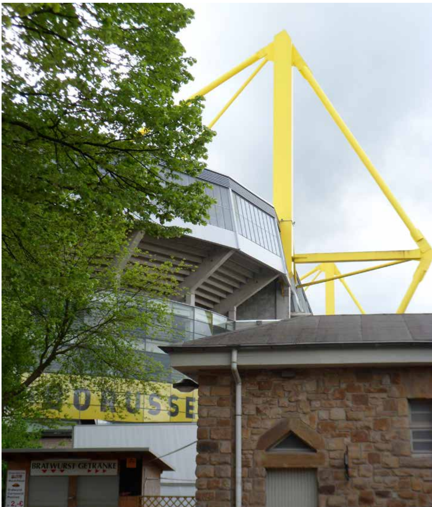
Das Westfalenstadion – die Heimat der Rainbow-Borussen