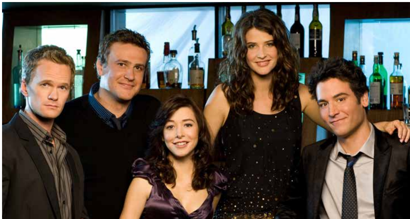
Die US-Fernsehserie „How I met your mother“ spiegelt eine fast schon verloren geglaubte Faszination für eine der schönsten Nebensache der Welt wieder: Die Kennenlerngeschichte

situation. Und je mehr ich darüber nachdachte, desto mehr fiel mir auf, dass dieser ewige Prüfstand-Zirkus uns letztendlich doch von