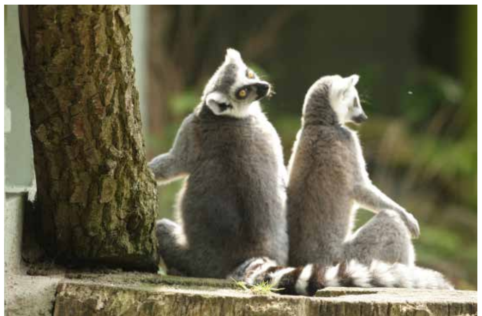
Katta-Pärchen sucht die Zweisamkeit

Nach Stunden des Turtelns wird es auch im Zoo Nacht: Die Liebespärchen ziehen sich zum Schäferstündchen zurück in ihre Nester. Der Zoobesuch hinterlässt Eindrücke von tierischer Liebe, die berühren, anstoßen wie auch verwundern kann. Auch wenn viele Emotionen und Gefühle in die Tiere hineininterpretiert und vermenschlicht werden: die Liebesbeziehungen im Zoo sind definitiv mehr als der reine Fortpflanzungsakt.