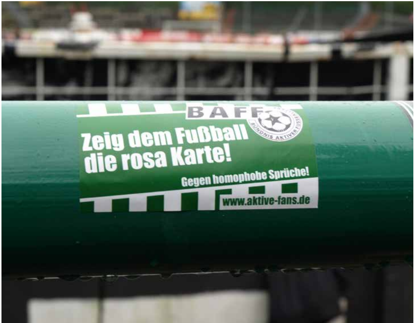
„Gegen homophobe Sprüche“ – Aufkleber im Preußenstadion in Münster