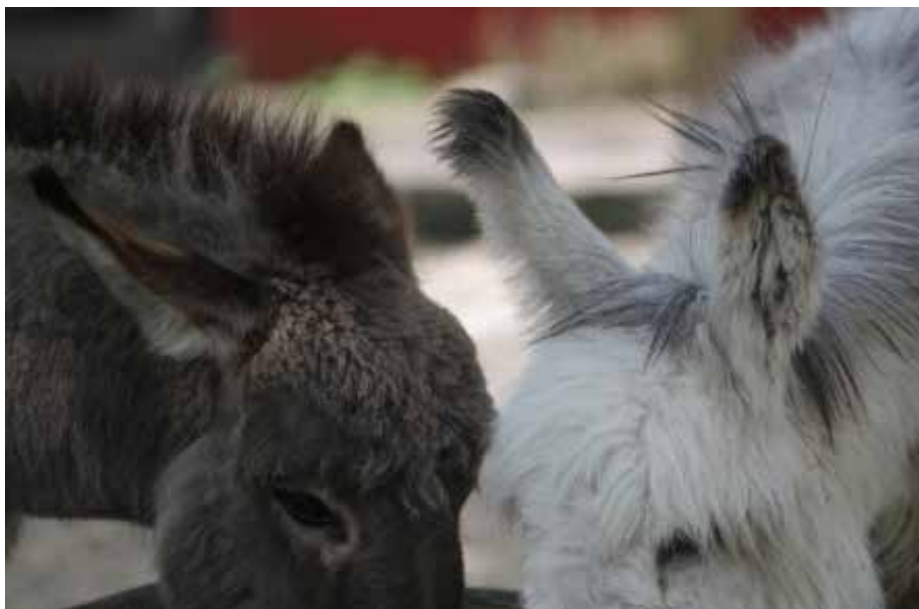
Poitou-Riesenesel kommen sich näher

benfrohe Bodennestlauben und legen im Anschluss ganze Wege aus, unter anderem mit bunten Plastikschnitzeln. Die Herren unter den Webervögeln bauen gleich mehrere architektonisch kunstvolle Nester. Das umworbenen Weibchen inspiziert daraufhin das Immobilienangebot und entscheidet sich für das schönste Domizil. So wird der geschickteste Bauherr zum glücklichen Bräutigam. Aus menschlicher Sicht ein materialistischer Charakterzug - dabei überprüfen die Vogeldamen lediglich, wie geschickt die Herren ihre Aufgabe meistern, um so auf Fitness und Gene der Kavaliere zurückzuschließen. Der tiefste Griff in die tierische Verführungs-Trickkiste bleibt wirkungslos, wenn der Mitbewohner im Gehege schneller war: zur Paarungszeit werden Nebenbuhler daher gnadenlos ausgeschaltet. Massive Kämpfe, in denen es sogar manchmal mal um Leben oder Tod geht, sind dann an der Tagesordnung. So treten und schlagen Giraffenbullen ihre Kontrahenten bis zur Bewusstlosigkeit. Ob Platzhirsch zwischen neuen