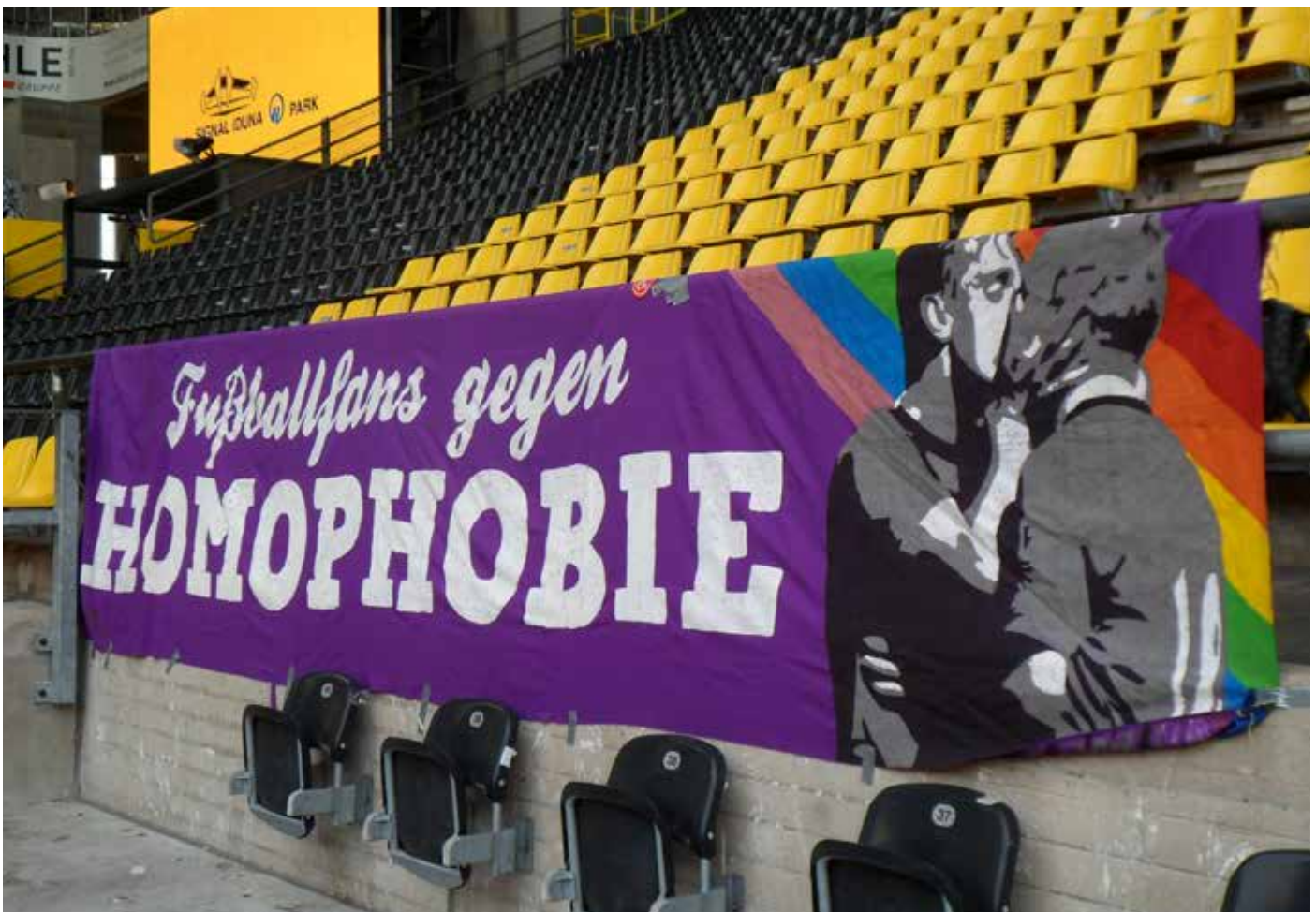
Die „Fußballfans gegen Homophobie“ – Fahne bei ihrem Gastspiel im Westfalenstadion

nale kann dann ja auf dem nächsten Fußballturnier der Queer Football Fanclubs steigen – zwischen den Rainbow-Borussen und dem Münchener Homosexuellen Fanclub „Queerpass Bayern“.