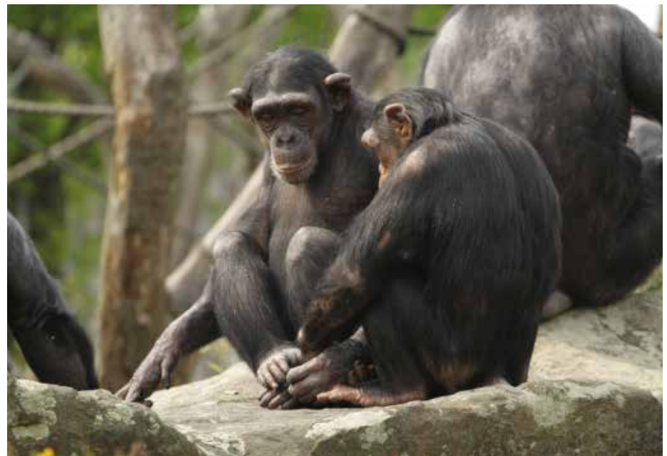
Hand in Hand: Schimpansen im Münsteraner Zoo

hen Frisuren zu beeindrucken. Je auffälliger Fell oder Gefieder, desto besser: der schillernde Schönling gewinnt die Gunst der Dame. Darüber hinaus buhlen die männlichen Zoobewohner durch aktives Verhalten um ihre Auserwählte. Kleine Geschenke und Aufmerksamkeiten gelten auch im Tierreich als Zeichen der Liebe. Im Affengehege servieren männliche Schimpansen ihren Auserwählten süße Früchte – und sind damit erwiesenermaßen erfolgreicher als geizigere Artgenossen. Ein ganz besonders