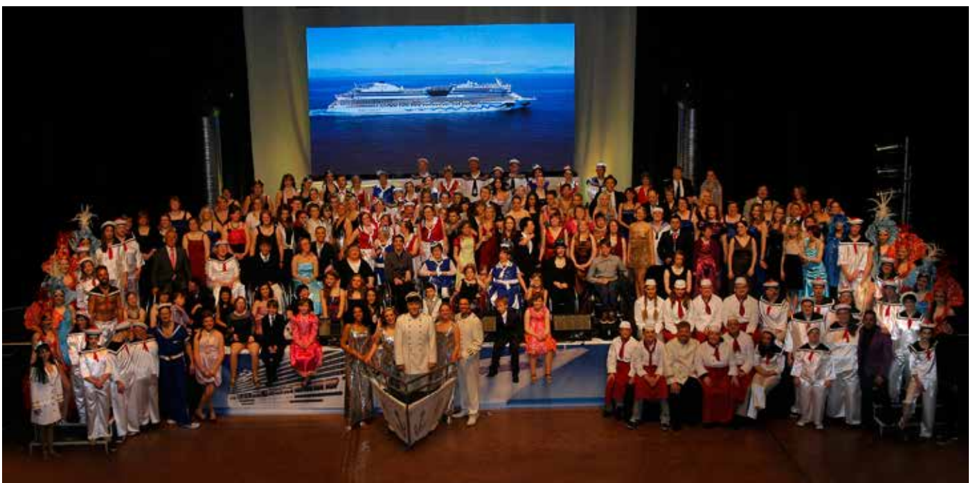
Das Ensemble des Musical „Magic Journey“: Das Foto zeigt, wie viele Menschen auf der Bühne standen und zeigt deren Dimensionen.

Und die „Funkies“ ruhen sich keineswegs auf ihren Lorbeeren