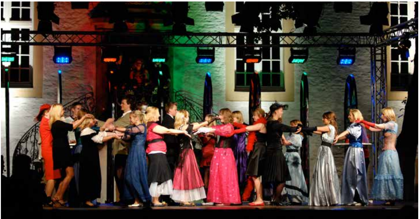
„Jedermann“ im Falkenhof Rheine (2008)