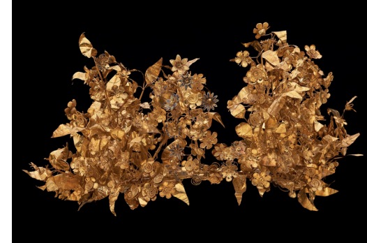
Myrtenkranz aus goldenen Blüten, aus illegalen Grabungen in Nordgriechenland, 350-300 v. Chr., 1993 ans J. Paul Getty Museum gelangt und seit 2005 im Archäologischen Museum Thessaloniki.

Kykladenidol, 2700-2300 v. Chr., aus der Sammlung des Badischen Landesmuseums und 2014 an Griechenland restituiert.