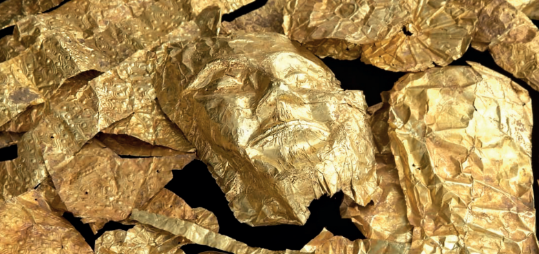
Goldobjekte aus der Raubgrabung eines Friedhofs bei Thessaloniki, 2011 konfisziert.