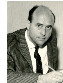
HANS BLUMENBERG – NAMENS GEBER DER GASTPROFESSUR

Der international viel gelesene und interdisziplinär breit rezipierte Philosoph Hans Blumenberg (1920 – 1996) wirkte als Professor an der Universität Münster. Mit seinen Studien trug er wesentlich dazu bei, die Bedeutung des Begriffs der „Neuzeit“ in geschichtswissenschaftlichen und philosophischen Diskussionen zu bestimmen. Er stellte die damals vorherrschende Säkularisierungstheorie in Frage, nach der theologische Deutungsmuster aus dem Mittelalter