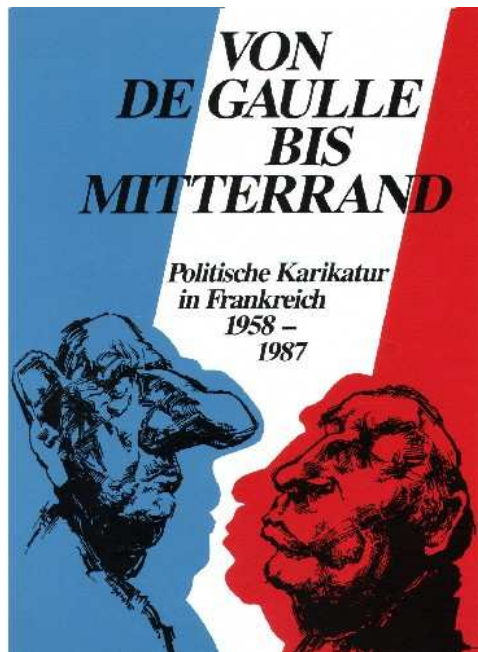
Von de Gaulle bis Mitterrand. Politische Karikatur in Frankreich 1958 - 1987